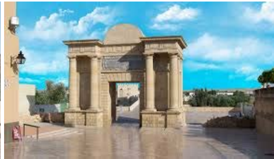
Desfile de las Cofradías por el Casco Histórico