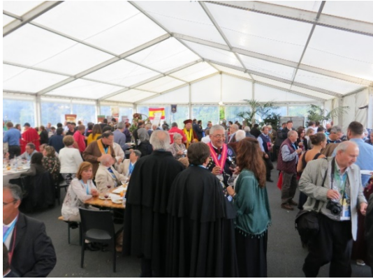
Muestra Enogastronómica de las Cofradías CEUCO