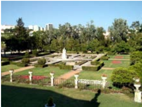
Jardines del Palacio del Marquês de Pombal

Sábado, 5 de Noviembre – Almuerzo, degustación gastronómica de productos