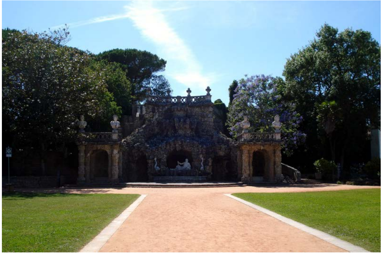
Jardines del Palacio del Marquês de Pombal

Conseil Européen des Confréries Oenogastronomiques Consiglio Europeo di Confraternite Enogastronomiche Consejo Europeo de Cofradías Enogastronómicas Conselho Europeu de Confrarias Enogastronómicas European Oenogastronomic Brotherhoods Council Ευρωπαϊκό Συμβούλιο Αδελφότητων Γαστρονομίας & Οινολογίας Európai Bor és Gasztronómiai Egyesületek Szövetsége Europäischer Rat der Wein- und Gastronomie-Bruderschaften