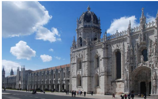
Misa en la Iglesia del monasterio de los Jerónimos

Domingo, 6 de Noviembre – Almuerzo de despedida