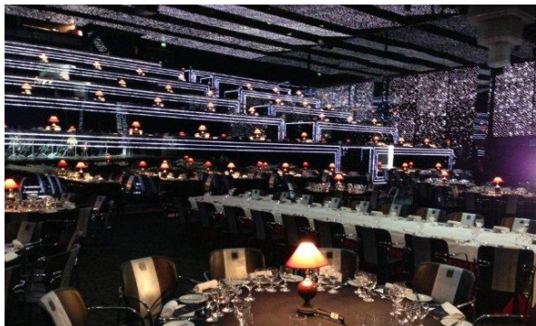
20:30 Cena de Gala en el Salón Negro y Plata del Casino de Estoril

Conseil Européen des Confréries Oenogastronomiques Consiglio Europeo di Confraternite Enogastronomiche Consejo Europeo de Cofradías Enogastrónomicas Conselho Europeu de Confrarias Enogastrónomicas European Oenogastronomic Brotherhoods Council Ευρωπαϊκό Συμβούλιο Αδελφοτήτων Γαστρονομίας & Οινολογίας Európai Bor és Gasztronómiai Egyesületek Szövetsége Europäischer Rat der Wein- und Gastronomie-Bruderschaften