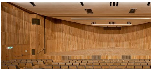
Auditorio del Congreso

Sábado, 5 de Noviembre – Auditorio da la Señora de Boa Nova