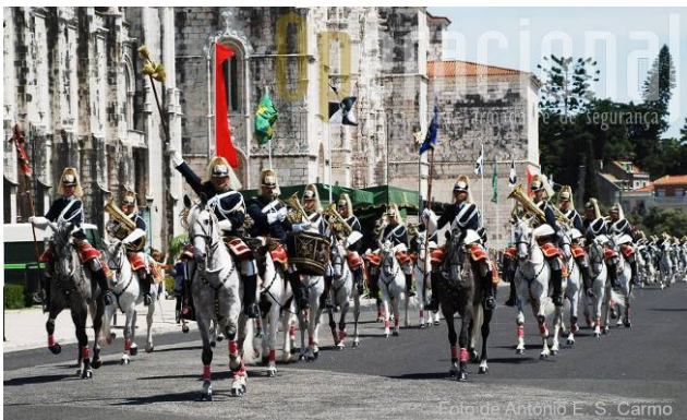
Desfile de las Cofradías con charanga de la GNR

Domingo, 6 de Noviembre – Desfile y Misa com Bendición de Estandartes