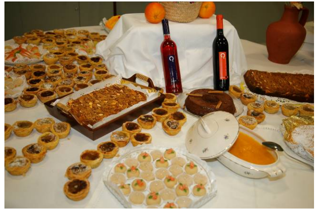
Muestra Enogastronómica de las Cofradías CEUCO

Sábado, 5 de Noviembre – CENA DE GALA – Casino Estoril