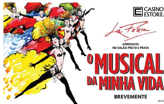
22:30 Espectáculo en el Casino de Estoril "El musical de mi vida"