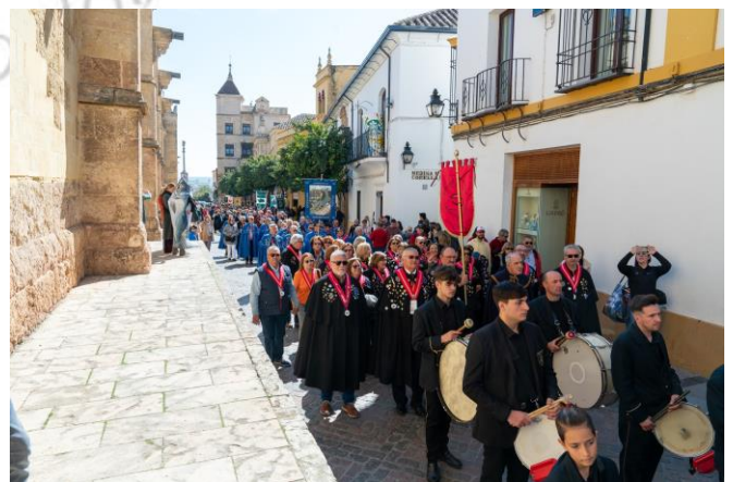
Desfile del I Capítulo