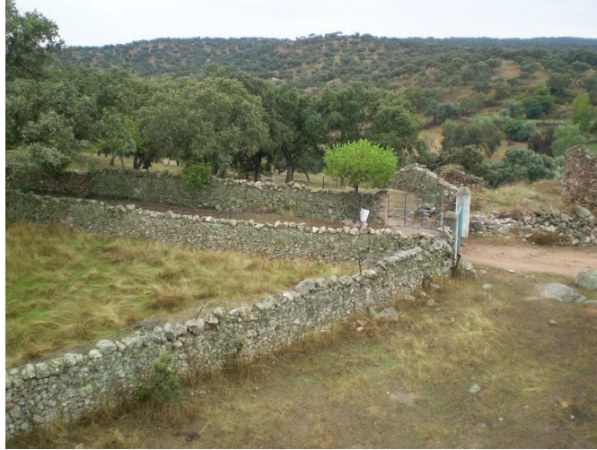
Detalle de las paredes de piedra

Cofradía Gastronómica del Salmorejo Cordobés - C/ San Basilio, 50, 14004 – Córdoba - C IF: G14854954