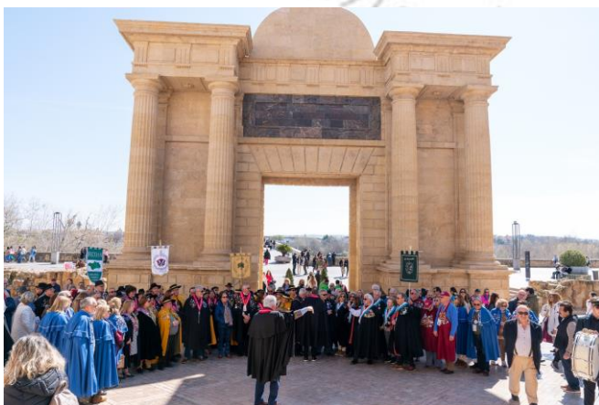
Concentración bajo el Arco del Triunfo