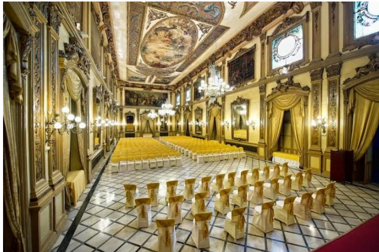
Salón Liceo del Real Círculo de la Amistad