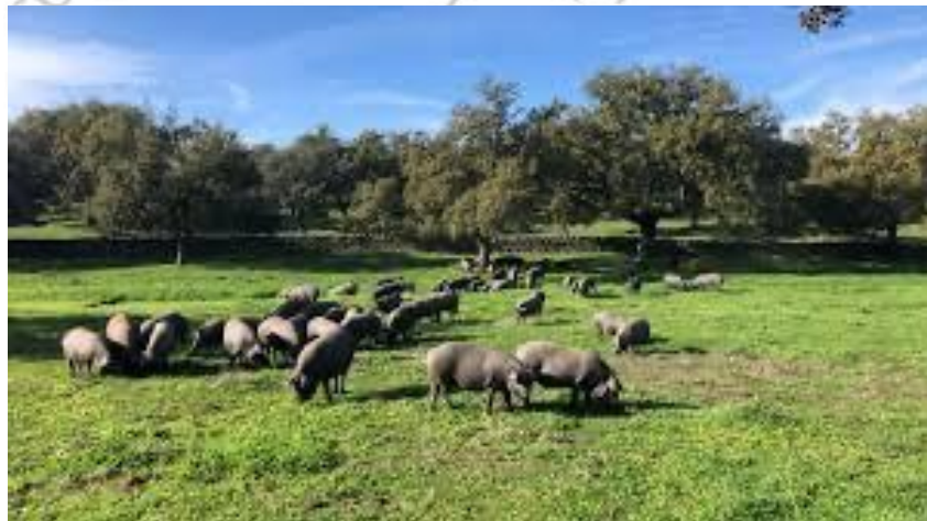
Explotación de cerdo ibérico en la Dehesa