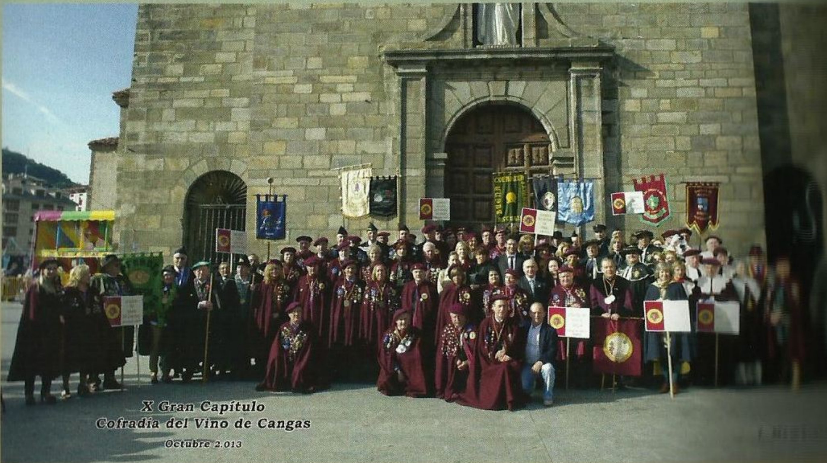
X Gran Capítulo Cofradía del Vino de Cangas Octubre 2.013