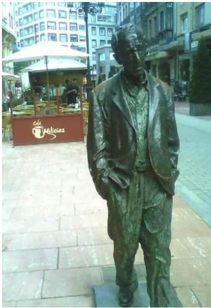
Estatua de Woody Allen