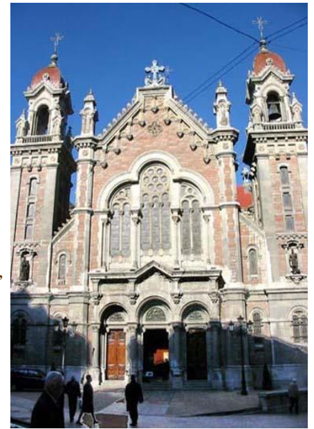
Iglesia de San Juan el Real

WOODY ALLEN Premio Príncipe de Asturias de las Artes 2002