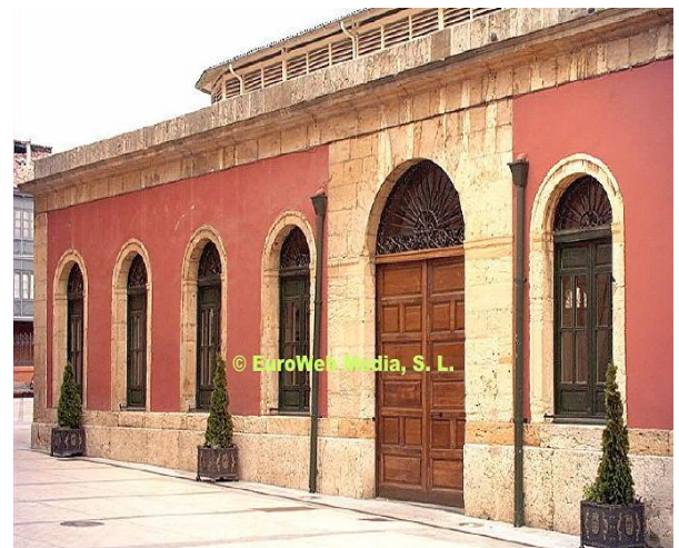
Plaza de Trascorrales

Después de la Santa Misa, desfile desde la Iglesia de San Juan el Real, precedidos por la banda de gaitas Ciudad de Oviedo, por la zona peatonal de la ciudad, hasta el Ayuntamiento, donde se desarrollarán los actos del III Gran Capítulo y a las 15 horas, tendrá lugar el almuerzo de confraternidad, en la Plaza Trascorrales.